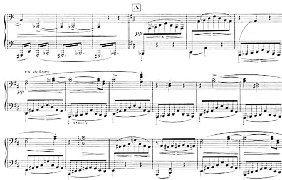
Пример 14. „Валсът“, тт. 63-80

В хармонично отношение Равел продължава линията, очертана в „Благородни и сантиментални валсове“: предпочитание към септакорди и нонакорди, богати и разширени структури и плътни вертикали. Въпреки сложността на тези хармонии, композиторът запазва яснота в педалната логика – изпълнителят може без затруднение да проследи хармоничната опора. Например в такт 66, въпреки че повечето ноти са извън основния акорд, педалът недвусмислено се основава на тоналността ре мажор (Пример 14).