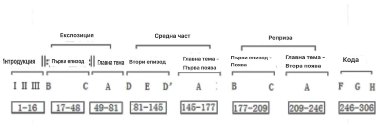
Пример 1. Структурна схема на “Валс в ла-бемол мажор”, оп. 34, № 1

В структурно отношение валсът следва принципа на триделността, организиран под формата на рондо. Шопен прилага специфичен модел на „рефрен“, характерен за европейския народен танц, при който повтарящата се секция не съвпада с началната тема на произведението (Пример 1).