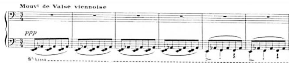
Пример 15. „Валсът“, мт. 1-6