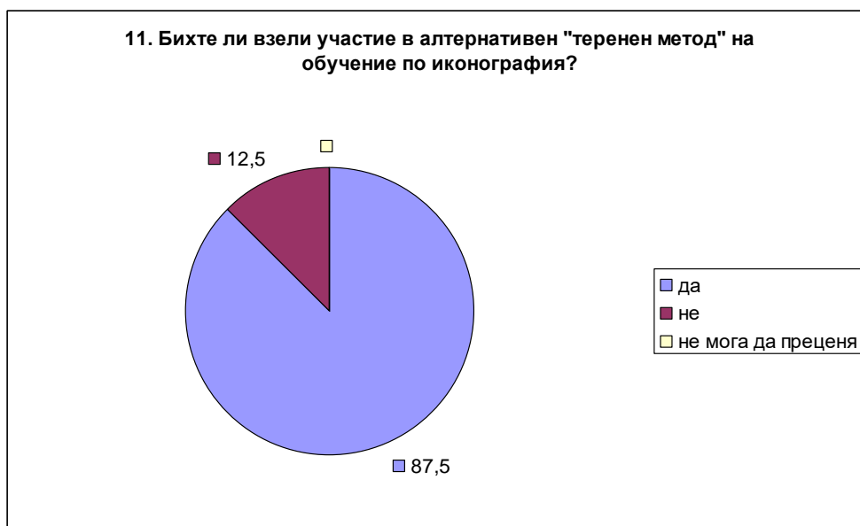
Фиг. 2. Диаграма с резултатите от Анкетна карта № 1. Въпрос 11.