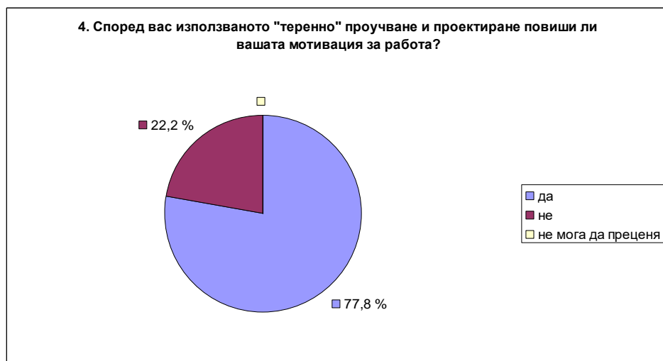
Фиг. 3. Диаграма на резултатите от Анкетна карта № 2 (Въпрос 4)